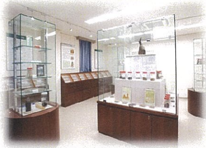
※和漢医薬学総合研究所・ 民族薬物資料館内の標本

平成24年7月19日(木) 金沢大学角間キャンパス 自然科学系図書館G1階 AVホール